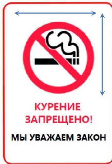
Обязательная часть знака 200 мм x 200 мм

Из всего вышесказанного можем прийти к следующему выводу: граждане РФ могут свободно парить электронные сигареты, так как это не запрещено законом! Так будет и в 2017 году.